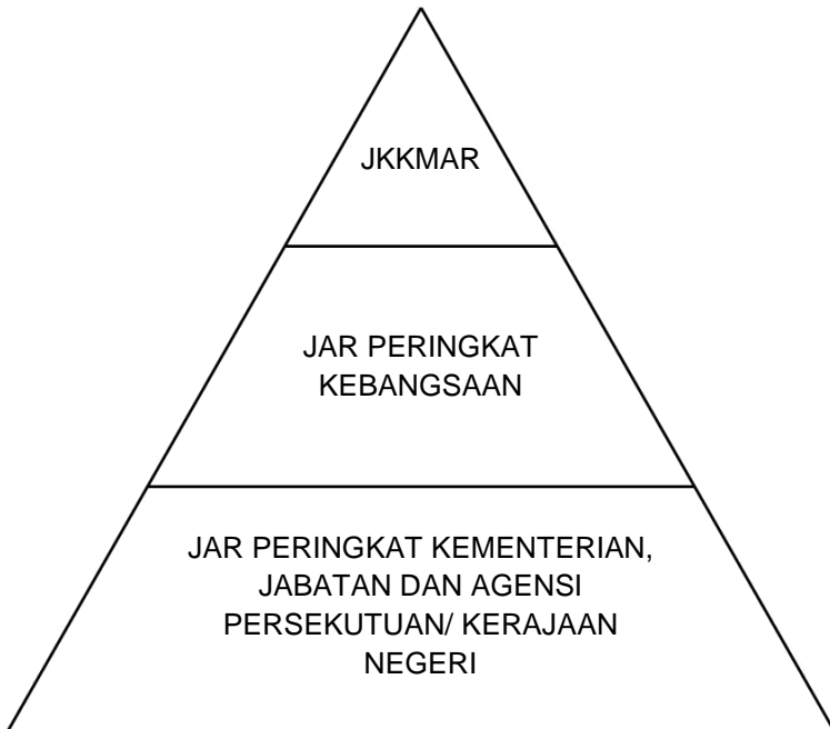
Rajah 1: Hubung Kait Peranan JKKMAR, JAR Peringkat Kebangsaan dan JAR Peringkat Kementerian, Jabatan dan Agensi Persekutuan/ Kerajaan Negeri